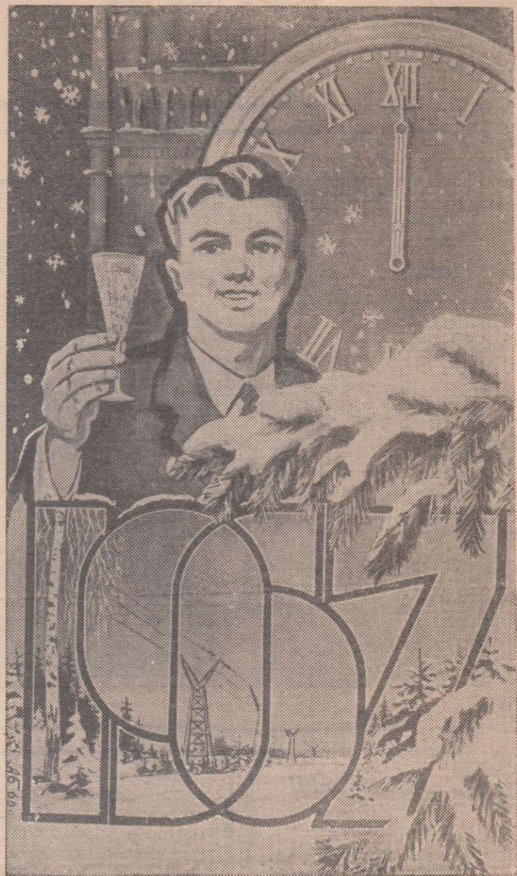
Плакат художника Б. Антонова.